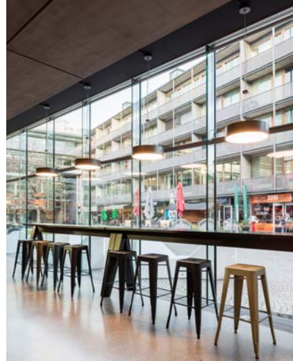
LAAC MSW PEX LS 019 SC