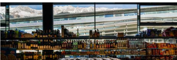
LAAC MSW PEX LS 022 SC