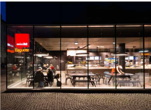
LAAC MSW PEX LS 020 SC