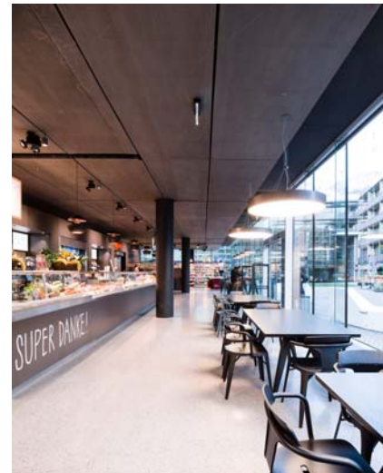
LAAC MSW PEX LS 021 SC