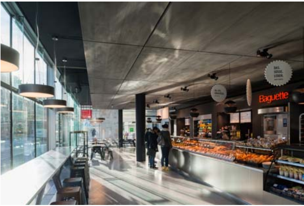
LAAC MSW PEX LS 019 SC