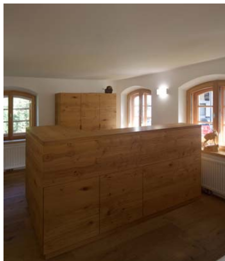
LAAC WDM PIC GRW 063 SC