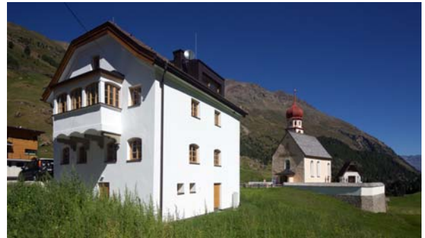
LAAC WDM PIC GRW 013 SC