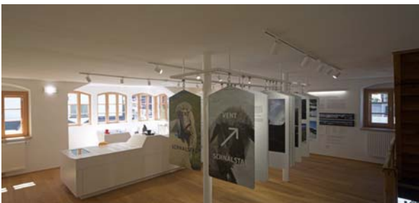
LAAC WDM PIC GRW 016 SC