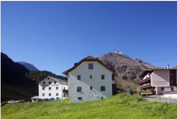
LAAC WDM PIC GRW 011 SC