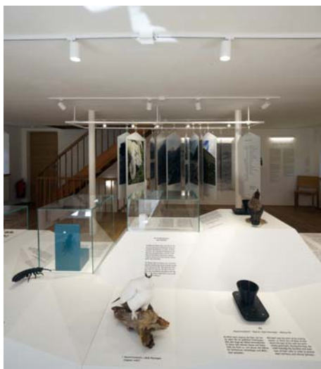
LAAC WDM PIC GRW 035 SC