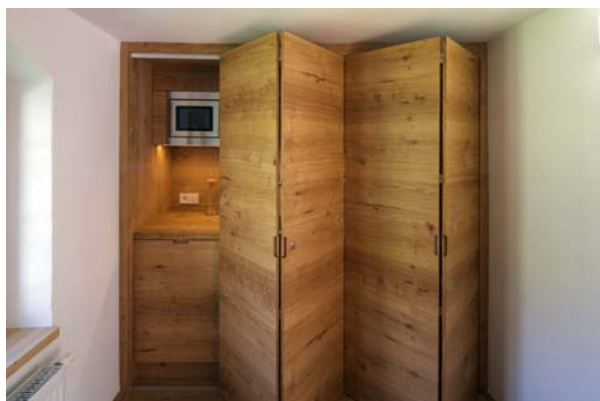
LAAC WDM PIC GRW 060 SC